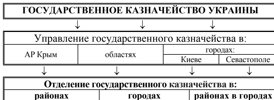
Рис. 1. Организационная структура Госказначейства Украины

Организационная структура Государственного казначейства воссоздает структуру административно-территориального устройства Украины [9].